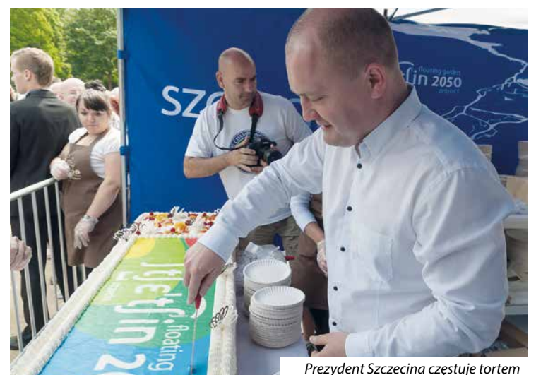
Prezydent Szczecina częstuje tortem

Warsztaty malowania talerzy i kubków we wzory ceramiki STETTINER WARE (Towary Szczecińskie). Nauka podstawowych technik ceramiki artystycznej, zdobienie wykonanych naczyń. Wielkoformatowa Malowanka „Ulice naszego miasta”