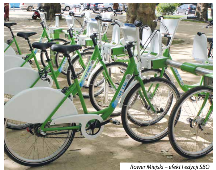
Rower Miejski – efekt I edycji SBO

Prawo udziału w głosowaniu będą mieli mieszkańcy zameldowani w Szczecinie którzy ukończyli 16 rok życia, a także studenci nieposiadający zameldowania, zamieszkali i studujący na terenie Szczecina, na podstawie legitymacji studenckiej wyłącznie w głosowaniu papierowym oraz uczniowie , którzy ukończyli 16 rok życia nieposiadający zameldowania, zamieszkali i uczęszczający do szkół na terenie Szczecina, na podstawie legitymacji uczniowskiej wyłącznie w głosowaniu papierowym. Gło-