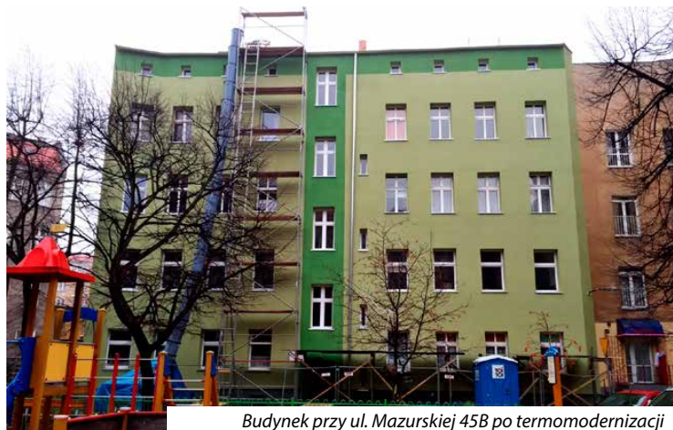
Budynek przy ul. Mazurskiej 45B po termomodernizacji