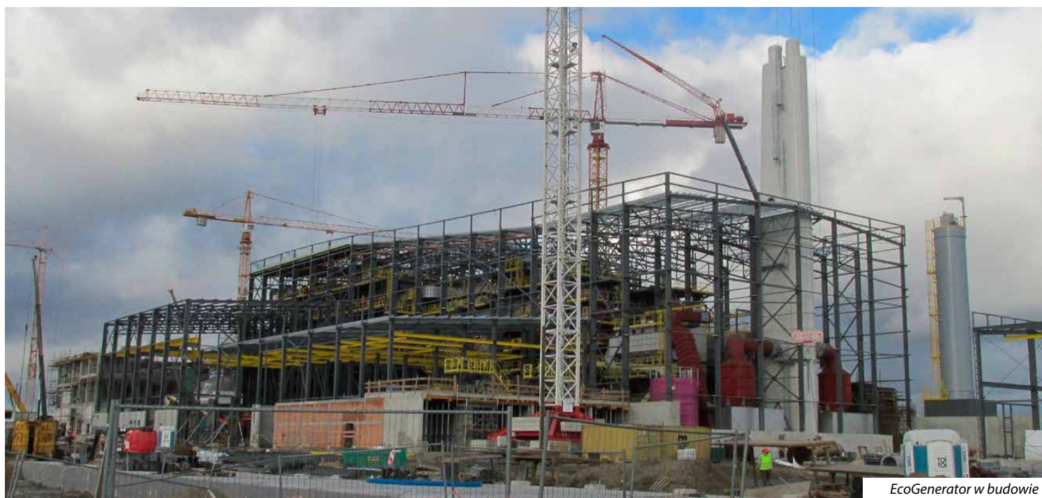
EcoGenerator w budowie

Ale to tylko początek. Kolejne elementy systemu oczyszczania spalin szczecińskiej spalarni to: