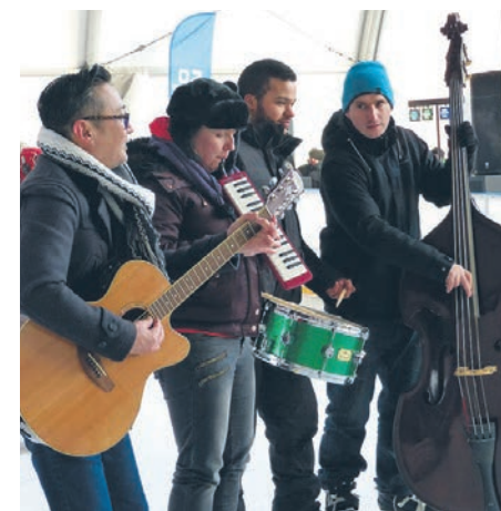
Muzycy Szczecin Jazz zagraли jazz na łyżwach! I to w nie byle jakim składzie, gdyż na lodowisku Azoty Areny pojawiło się kilkunastu artystów z USA, Japonii, Niemiec i Polski.