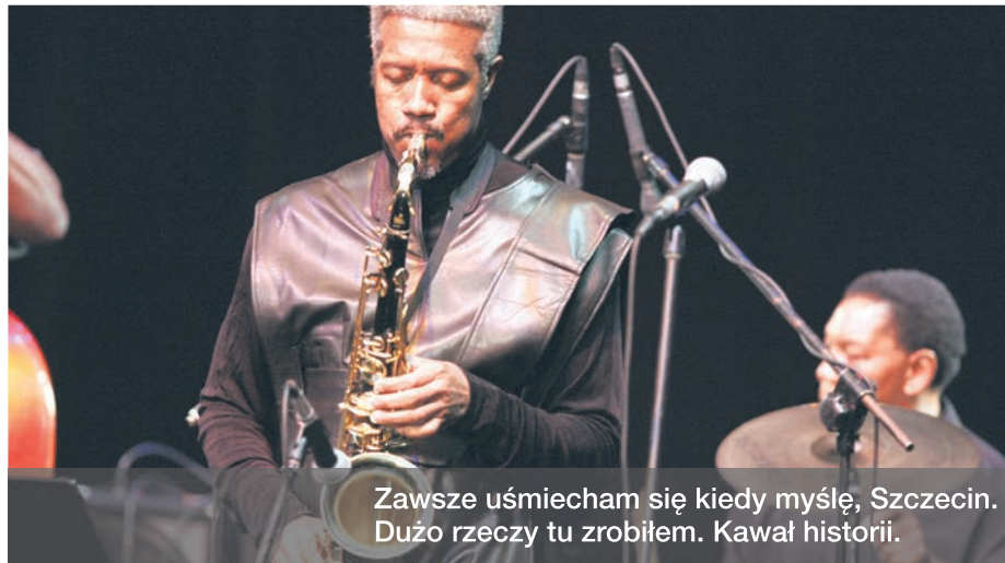
Zawsze uśmiecham się kiedy myślę, Szczecin. Dużo rzeczy tu zrobiłem. Kawał historii.

Przyglądam się Szczecinowi z perspektywy USA, skąd pochodzę i gdzie ukształtowałem się jako artysta oraz z perspektywy Berlina, gdzie obecnie mieszkam. Imponuje mi Szczecin Jazz i to co robicie. Doskonale znacie tradycję jazzu. W programie widać wiele ukłonów w stronę tradycji mainstreamu. A jednocześnie jesteście otwarci na nowe rzeczy. Żyjemy w XXI wieku, gdzie dla każdego, a przede wszystkim dla młodego człowieka, podstawowym narzędziem to telefon, a bycie mobilnym jest jak bycie wolnym. Czuję tego ducha w Szczecinie, jak również wyczuwam ten zamysł w programie waszych koncertów. Podoba mi się wasze hasło „Jazz comes to You”. Chcę być blisko ludzi zarówno offline jak i online. To jest to!