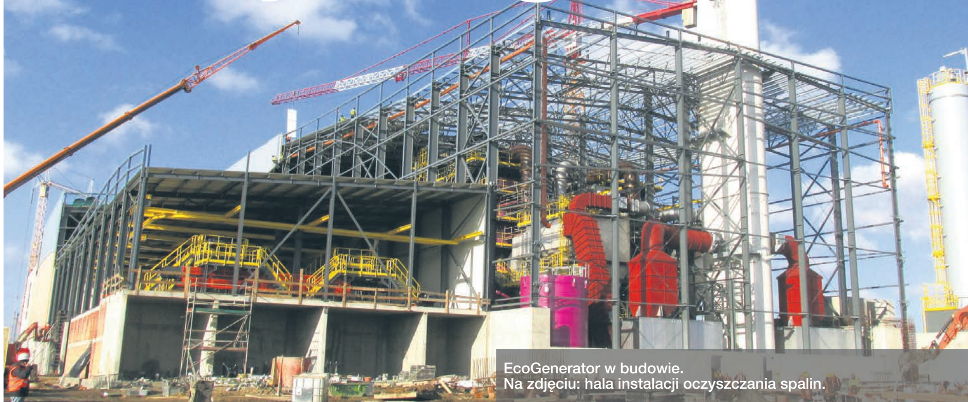
EcoGenerator w budowie. Na zdjęciu: hala instalacji oczyszczania spalin.

Nie węgiel, nie ropa ani budzący emocje atom, a zwykle, niepotrzebne nikomu odpady komunalne będą paliwem dla supernowoczesnej elektrociepłowni, która powstaje w szczecińskim porcie.