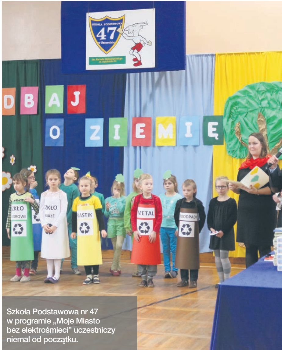
Szkoła Podstawowa nr 47 w programie „Moje Miasto bez elektrośmieci” uczestniczy niemal od początku.

Szkoła Podstawowa nr 47 w Szczecinie aktywnie uczestniczy w edukacyjnym programie „Moje miasto bez elektrośmieci”. Za duże zaangażowanie w zbieraniu zużytego sprzętu elektrycznego i elektronicznego została nagrodzona tablicą interaktywną.