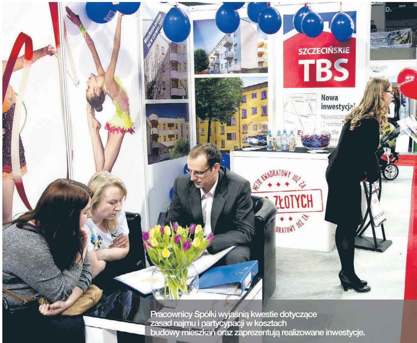
Pracownicy Spółki wyjaśnią kwestie dotyczące zasad najmu i partycypacji w kosztach budowy mieszkań oraz zaprezentują realizowane inwestycje.

Kolejną realizowaną przez Szczecińskie TBS inwestycją mieszkaniową jest Osiedle Sienna przy ul. Pelikana, Łącznej i Flaminga na zboczu Wzgórz Warszawskich . Niewątpliwym