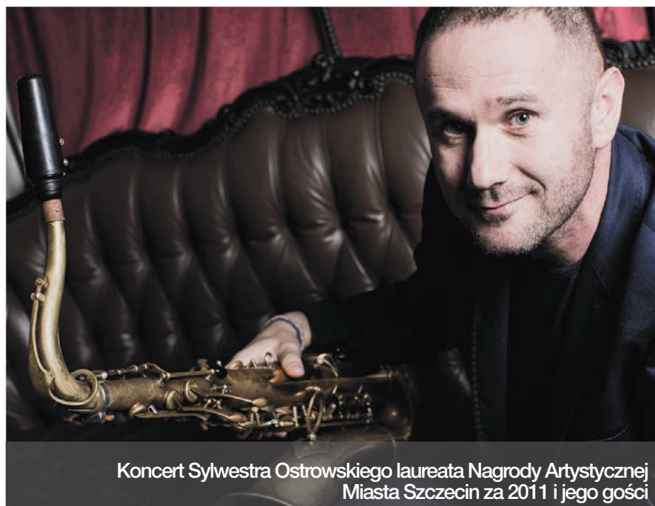
Koncert Sylwestra Ostrowskiego laureata Nagrody Artystycznej Miasta Szczecina za 2011 i jego gości

Przypominamy, że zostało jeszcze kilka dni (do 29 lutego) na zgłoszenie swojego kandydata, a za kilka tygodni – 5 kwietnia - wspomniana już uroczysta gala w Filharmonii, na którą już zapraszamy, a o szczegółach będziemy informować, m.in. na stronie www.saa.pl oraz www.szczecin.eu .