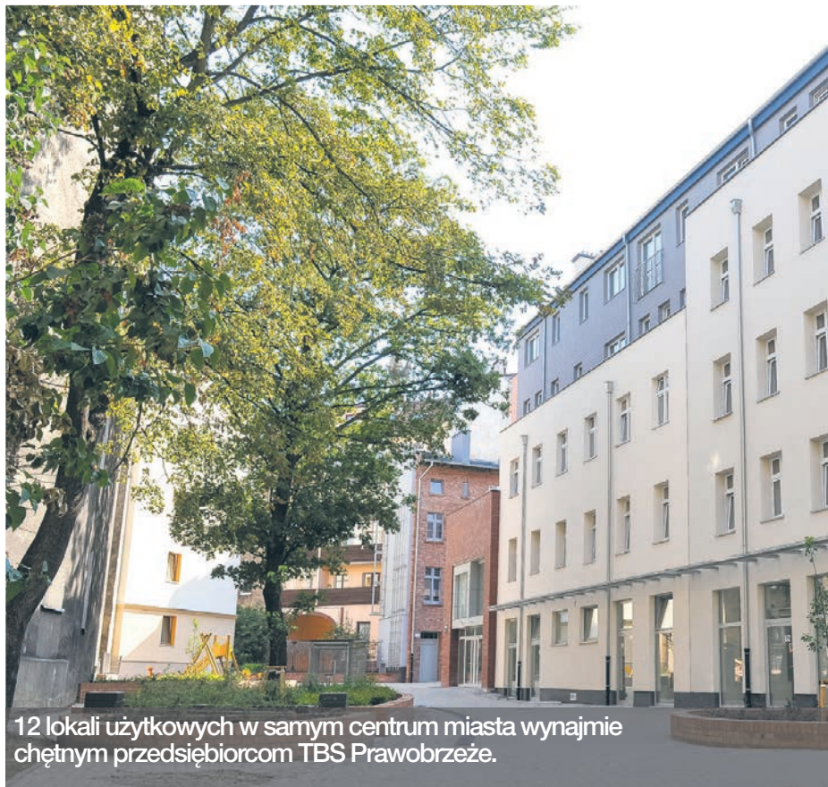
12 lokali użytkowych w samym centrum miasta wynajmie chętnym przedsiębiorcom TBS Prawobrzeże.

12 lokali użytkowych w samym centrum miasta wynajmie chętnym przedsiębiorcom TBS Prawobrzeże. Oferta dotyczy lokali położonych w obrębie zmodernizowanego i kompleksowo wyremontowanego kwartału w sąsiedztwie Parku Gen. Andersa, nieopodal placu Zgody i al. Wojska Polskiego.