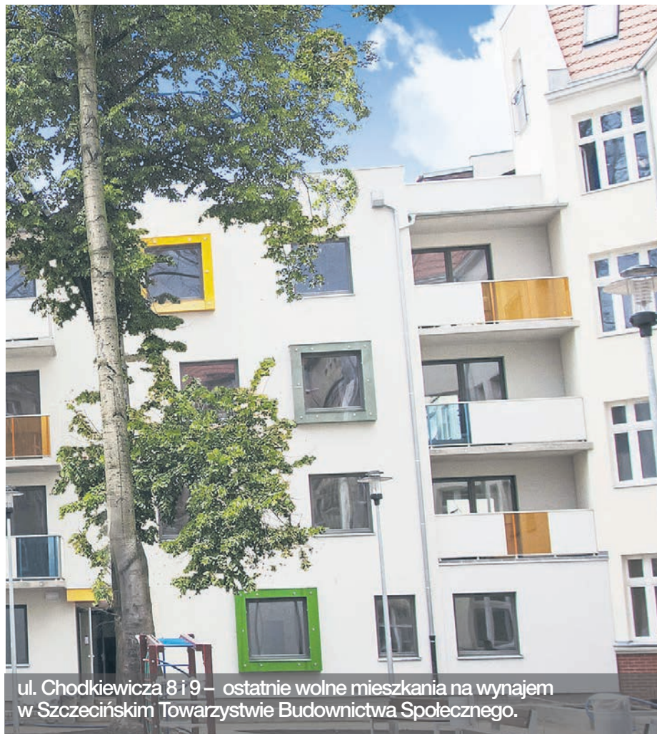
ul. Chodkiewicza 8 i 9 – ostatnie wolne mieszkania na wynajem w Szczecińskim Towarzystwie Budownictwa Społecznego.