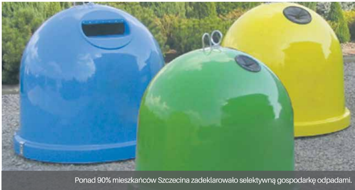
Ponad 90% mieszkańców Szczecina zadeklarowało selektywną gospodarkę odpadami.

Jednak prawdziwym hitem okazał się odbiór odpadów zielonych. Dynamika wzrostu tej usługi od wprowadzenia