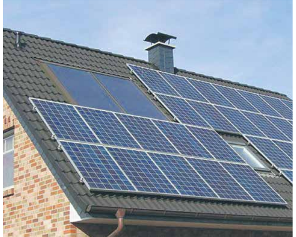
Na kolejnych budynkach, m.in. szkół i przedszkoli montowane są panele.

Były to 3 Domy Pomocy Społecznej oraz Szczeciński Dom Sportu przy ulicy Wąskiej.