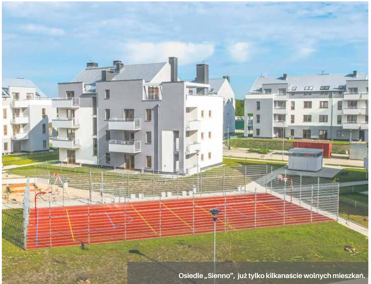
Osiedle „Sienno”, już tylko kilkanaście wolnych mieszkań.

W celu podkreślenia podmiejskiego charakteru zabudowy, przed mieszkaniami na parterze wydzielono indywidualne przedogródki, natomiast dla wszystkich mieszkań zlokalizowanych na I, II i III piętrze zapewniono balkon lub taras. W każdym budynku, w kondygnacji piw-