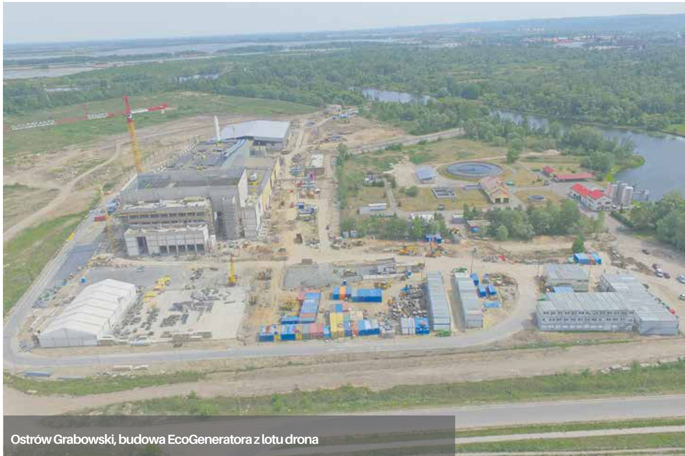
Ostrow Grabowski, budowa EcoGeneratora z lotu drona

Nie cztery, a dwa regiony gospodarki odpadami. EcoGenerator będzie mógł przyjmować odpady komunalne z całego województwa.