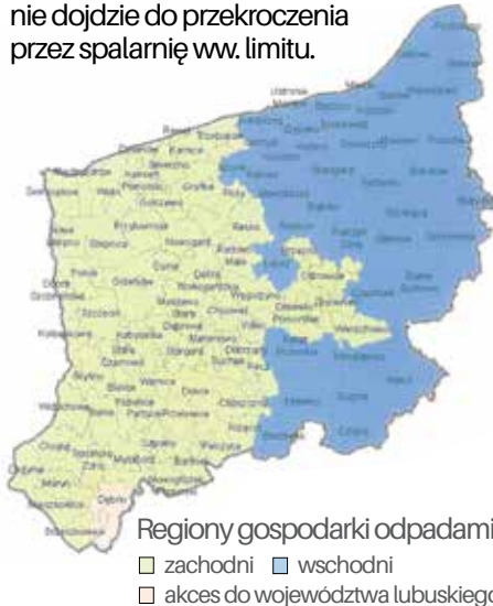
Regiony gospodarki odpadami □ zachodni □ wschodni □ akces do województwa lubuskiego

terenie województwa zachodniopomorskiego w 2014 roku zostało wytworzonych blisko 590 tys. ton odpadów komunalnych. Moce przerobowa EcoGeneratora to 150 tys. ton/rok, co stanowi 25% masy wytworzonych odpadów. Zgodnie z unijnymi przepisami do 2020 roku udział masy termicznie przekształconych odpadów komunalnych nie może być większy niż 30%. Oznacza to, że w województwie zachodniopomorskim nie dojdzie do przekroczenia przez spalarnię ww. limitu.