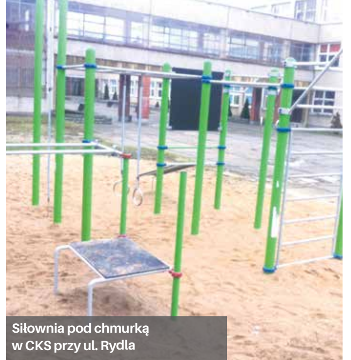
Siłownia pod chmurką w CKS przy ul. Rydla