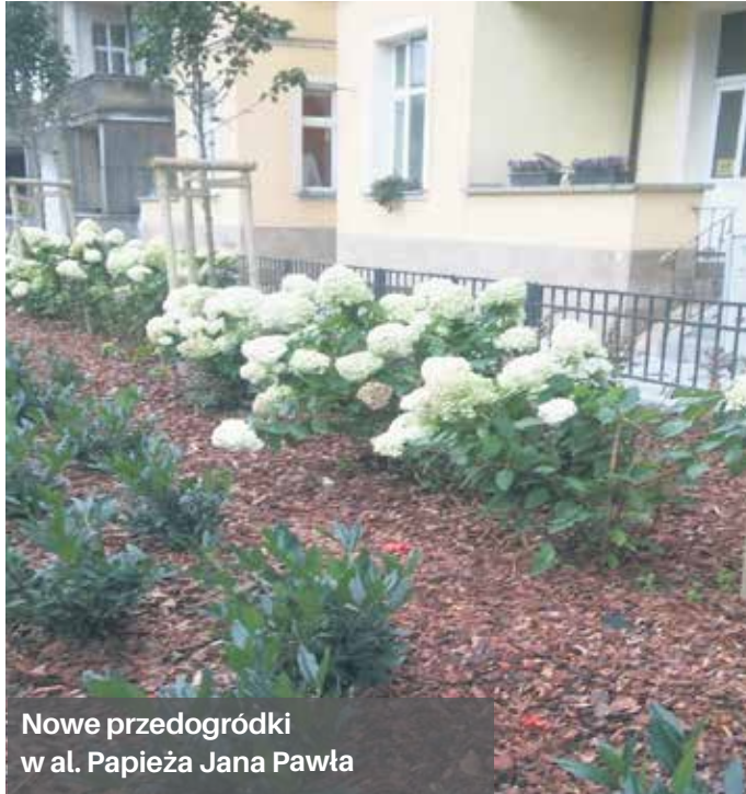
Nowe przedogródki w al. Papieża Jana Pawła

Program funkcjonuje od 2015 roku i kierowany jest do wspólnot mieszkaniowych, które mają zawarte porozumienie z Gminą lub Spółką komunalną na użytkowanie tego terenu.