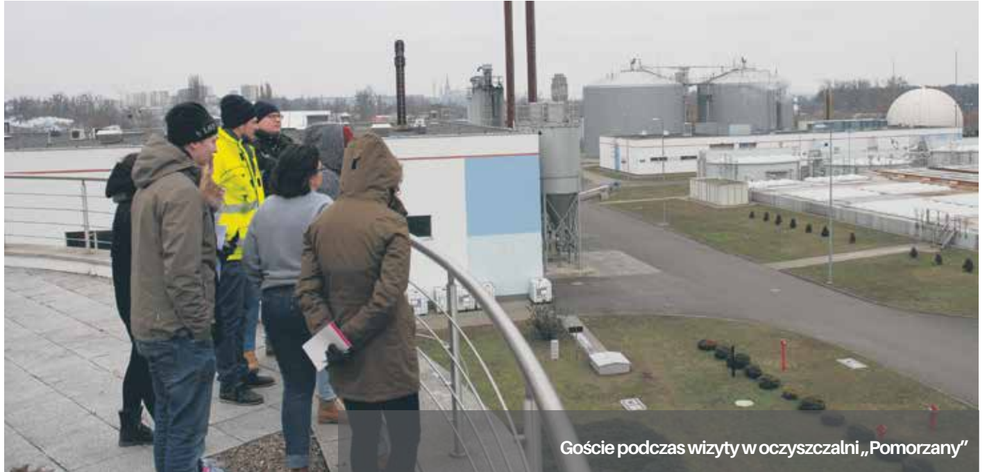
Goście podczas wizyty w oczyszczalni „Pomorzany”

W ramach współpracy przy realizacji tego projektu do Szczecina przybyli eksperci z Estonii (Uniwersytet w Tartu), oraz Niemiec (Politechnika Berlińska), którzy uczestniczyli w seminarium szkoleniowym i warsztatach programowych. Towarzyszyli im studenci inżynierii sanitarnej i środowiskowej ze Szwecji, Niemiec, Estonii oraz Finlandii. Goście odwiedzili oczyszczalnie ścieków „Pomorzany” oraz „Zdroje”, gdzie przeprowadzili badania audytorskie. Uczestnicy projektu zapoznali się szczegółowo z obiektami, a w ramach zajęć warsztatowych dokonali poboru próbek osadu ściekowego i zainstalowali specjalistyczne urządzenia do pomiaru energii. Pobrane próbki osadu zostaną poddane szczegółowym analizom w laboratorium w Estonii,