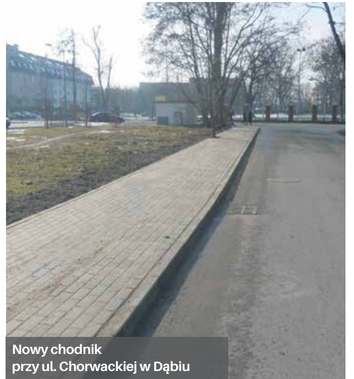
Nowy chodnik przy ul. Chorwackiej w Dąbiu