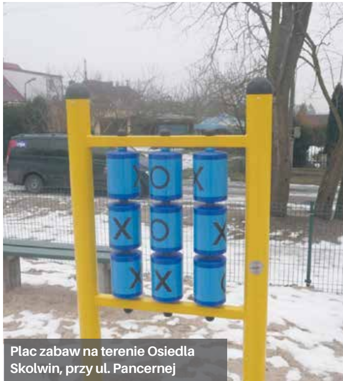
Plac zabaw na terenie Osiedla Skolwin, przy ul. Panczernej