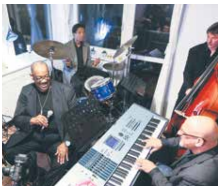
Domówka z jazzem Kevin Mahogany