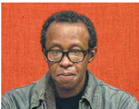
Matthew Shipp Trio (USA) „Piano Song” - 09.03