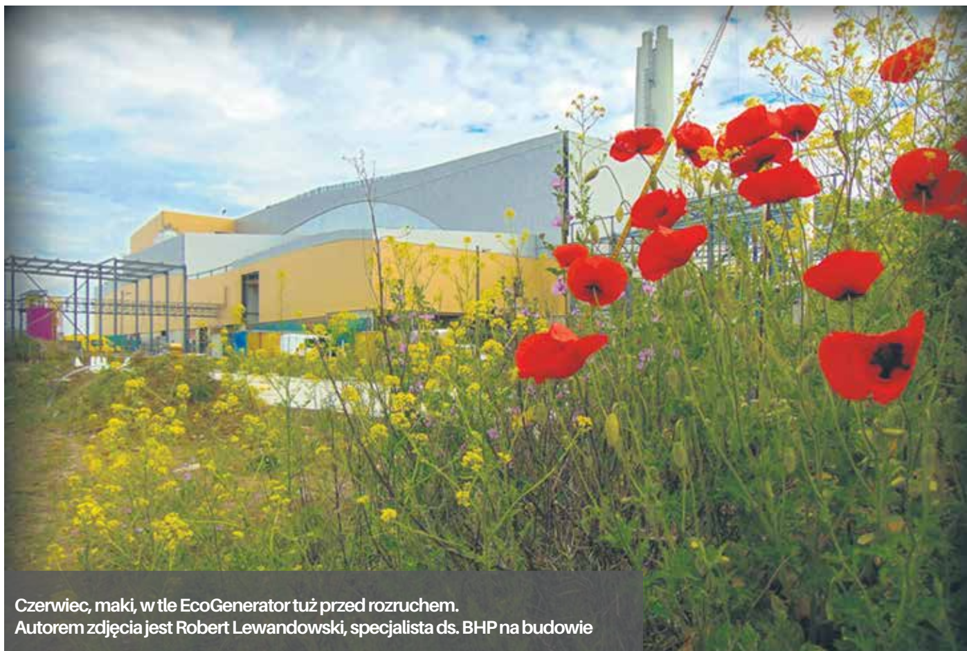
Czerwiec, maki, w tle EcoGenerator tuż przed rozruchem.