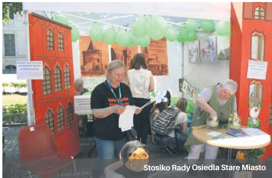
Stosiko Rady Osiedla Stare Miasto