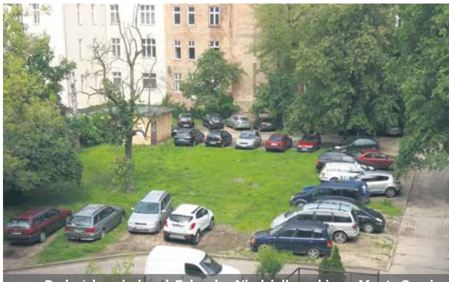
Podwórko między ul. Felczaka, Niedziałkowskiego, Monte Cassino i al. Papieża Jana Pawła II.

Nowe place zabaw, siłownię pod chmurką, alejki i nasadzenia powstaną w ramach modernizacji dwóch podwórek w śródmieściu Szczecina. Inwestycje są realizowane dzięki współpracy Urzędu Miasta z Radami Osiedla.