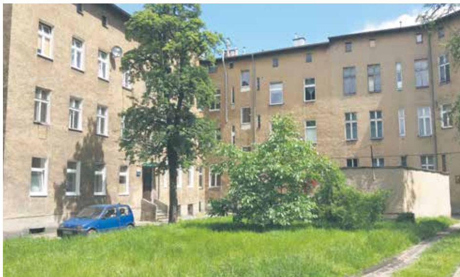
Prace rozpoczną się w kamienicy przy ul. Więckowskiego 6.

Termomodernizacja i remont elewacji 12 kamienic w śródmieściu Szczecina to plany Towarzystwa Budownictwa Społecznego „Prawobrzeże”.