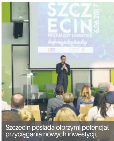
Szczecin posiada olbrzymi potencjał przyciągania nowych inwestycji.

Obrazują to liczby: w latach 2008-2012 w metropolii szczecińskiej utrzymywała się