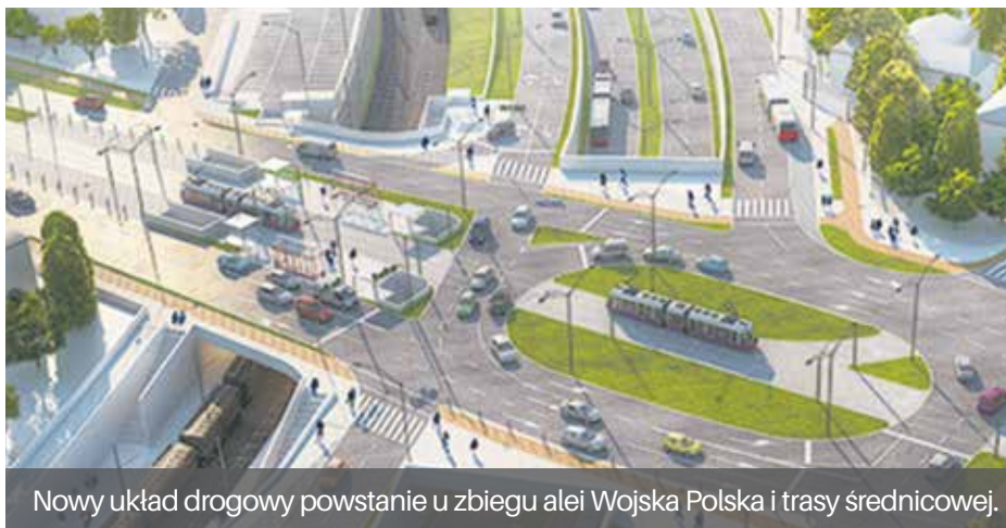
Nowy układ drogowy powstanie u zbiegu alei Wojska Polska i trasy średnicowej.

Szczecin otrzymał dofinansowanie na przebudowę węzła komunikacyjnego Łękno.