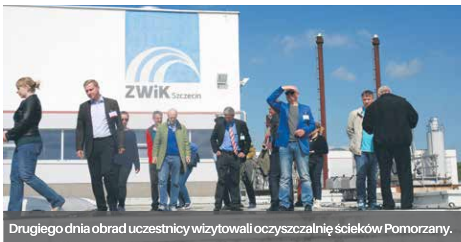
Drugiego dnia obrad uczestnicy wizytowali oczyszczalnię ścieków Pomorzany.

Realizacji projektu służą m.in. cykliczne konferencje gromadzące specjalistów z branży gospodarki sanitarnej i ochrony środowiska z krajów uczestniczących w programie IWAMA. Kolejna z nich odbyła się w dniach 7-8 czerwca 2017 r. w Szczecinie. Jej organizatorem był szczeciński ZWiK. W obradach wzięło udział blisko 90 osób m.in. z Niemiec, Danii, Holandii, Litwy, Łotwy, Finlandii i Szwecji. Główna część obrad odbyła się w hotelu Radisson Blu. W jej trakcie rozmawiano o skutecznych rozwiązaniach w procesie oczyszczania ścieków, a także nowoczesnych technologiach i rozwiązaniach służących zwiększeniu efektywności energetycznej gospodarki osadowej prowadzonej w oczyszczalniach. Drugiego dnia obrad uczestnicy wizytowali oczyszczalnię ścieków Pomorzany. Zwiedzili obiekt i szczegółowo zapoznali się ze stosowanymi tu rozwiązaniami.