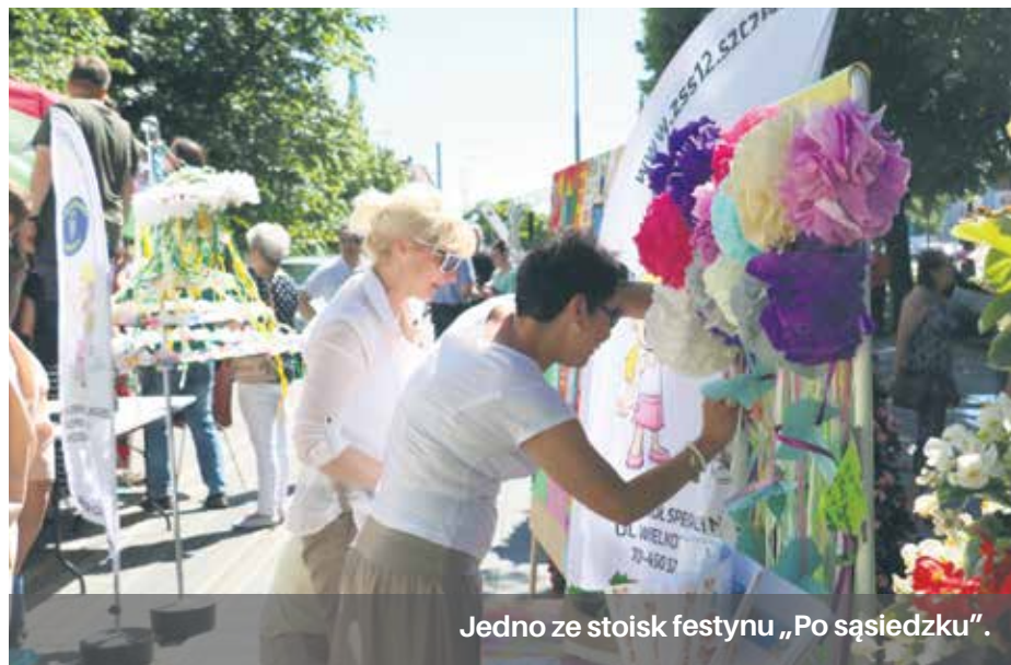
Jedno ze stoisk festynu „Po sąsiedzku”.