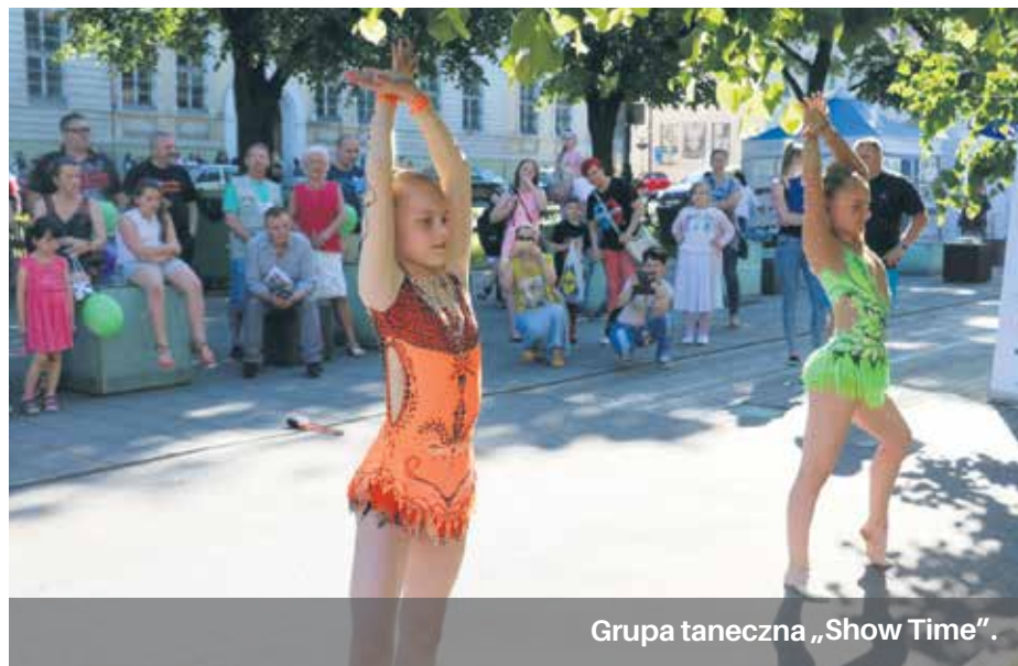
Grupa taneczna „Show Time”.