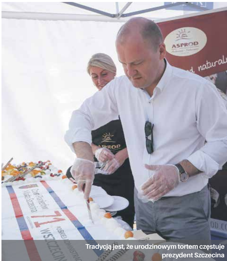
Tradycją jest, że urodzinowym tortem częstuje prezydent Szczecina

Od kilku lat, poza oficjalnymi uroczystościami urodzinowymi, mieszkańcy Szczecina spotykają się na Różance.