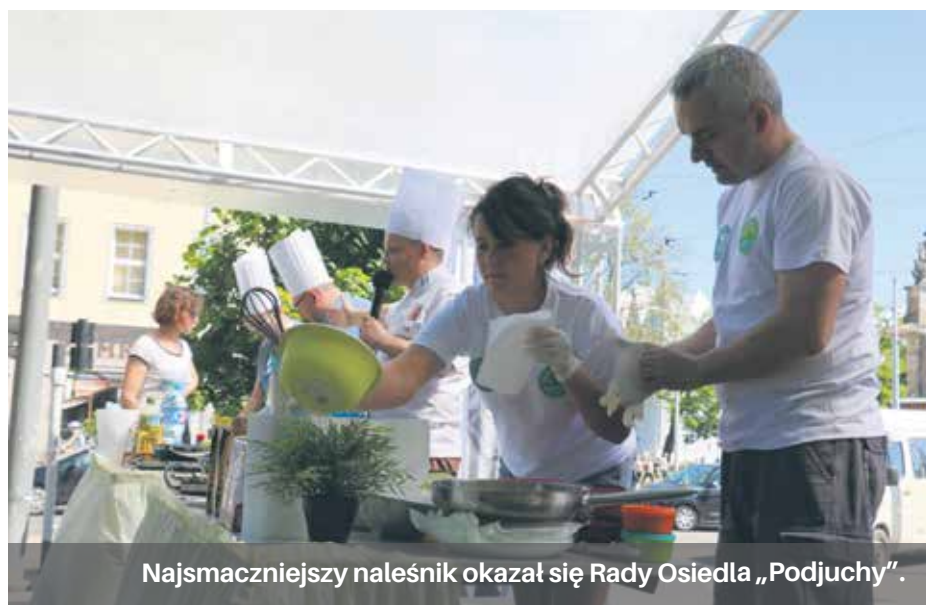
Najsmaczniejszy naleśnik okazał się Rady Osiedla „Podjuchy”.