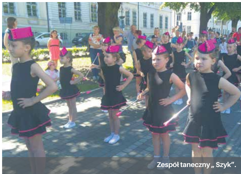
Zespół taneczny „Szyk”.