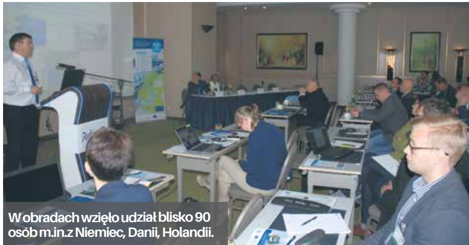
W obradach wzięło udział blisko 90 osób m.in. z Niemiec, Danii, Holandii.

Blisko 90 osób z krajów nadbałtyckich przyjechało do Szczecina na konferencję odbywającą się w ramach projektu IWAMA. Gospodarzem spotkania był Zakład Wodociągów i Kanalizacji.