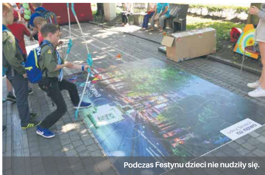
Podczas Festynu dzieci nie nudziły się.