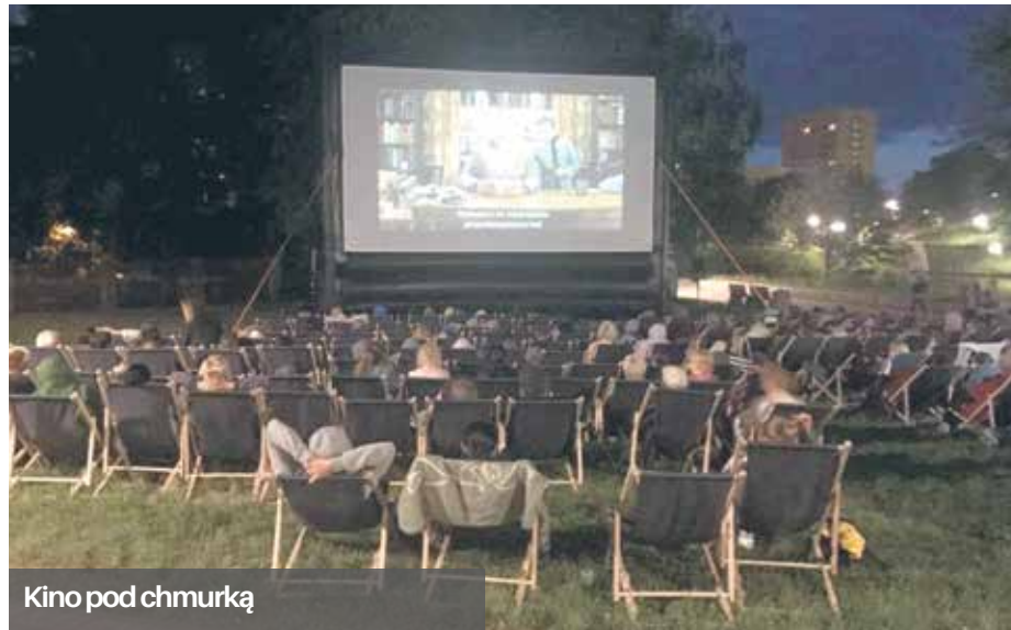
Kino pod chmurką

To była druga edycja wydarzenia, podczas której w każdą sobotę wakacji odbyło się dziewięć pokazów filmowych.