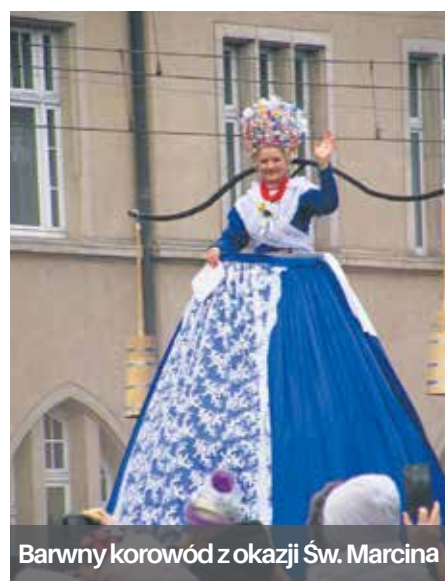
Barwny korowód z okazji Św. Marcina