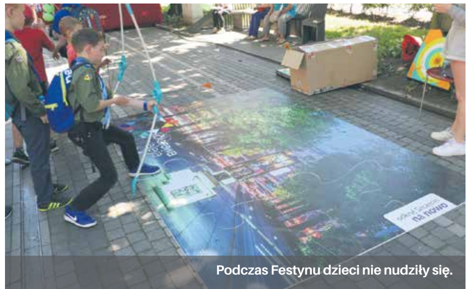
Podczas Festynu dzieci nie nudziły się.