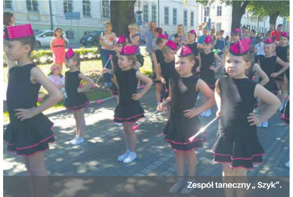
Zespół taneczny „Szyk”.

W strefie „zrób to sam” odbywało się malowanie solą, robienie makaronowych wisiorów, a także malowanie buzi. Dla tych, którzy chcieli poznać nieco historii okolic Szczecina zorganizowano dwie niezależne wycieczki z przewodnikiem, między innymi uliczkami Starego Miasta.