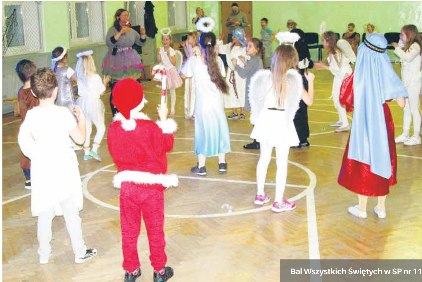
Bal Wszystkich Świętych w SP nr 11

We współpracy z parafią św. Stanisława Kostki oraz Komendą Miejską Policji w Szczecinie współorganizowaliśmy spotkanie przeznaczone dla osób starszych na temat mapy zagro-