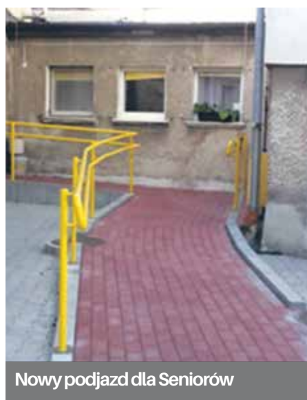
Nowy podjazd dla Seniorów

Wykonano tu rampę podjazdową, utwardzono plac postojowy, nowe nawierzchnie chodników, założono trawnik, posadzono drzewa i krzewy, zamontowano ławki.