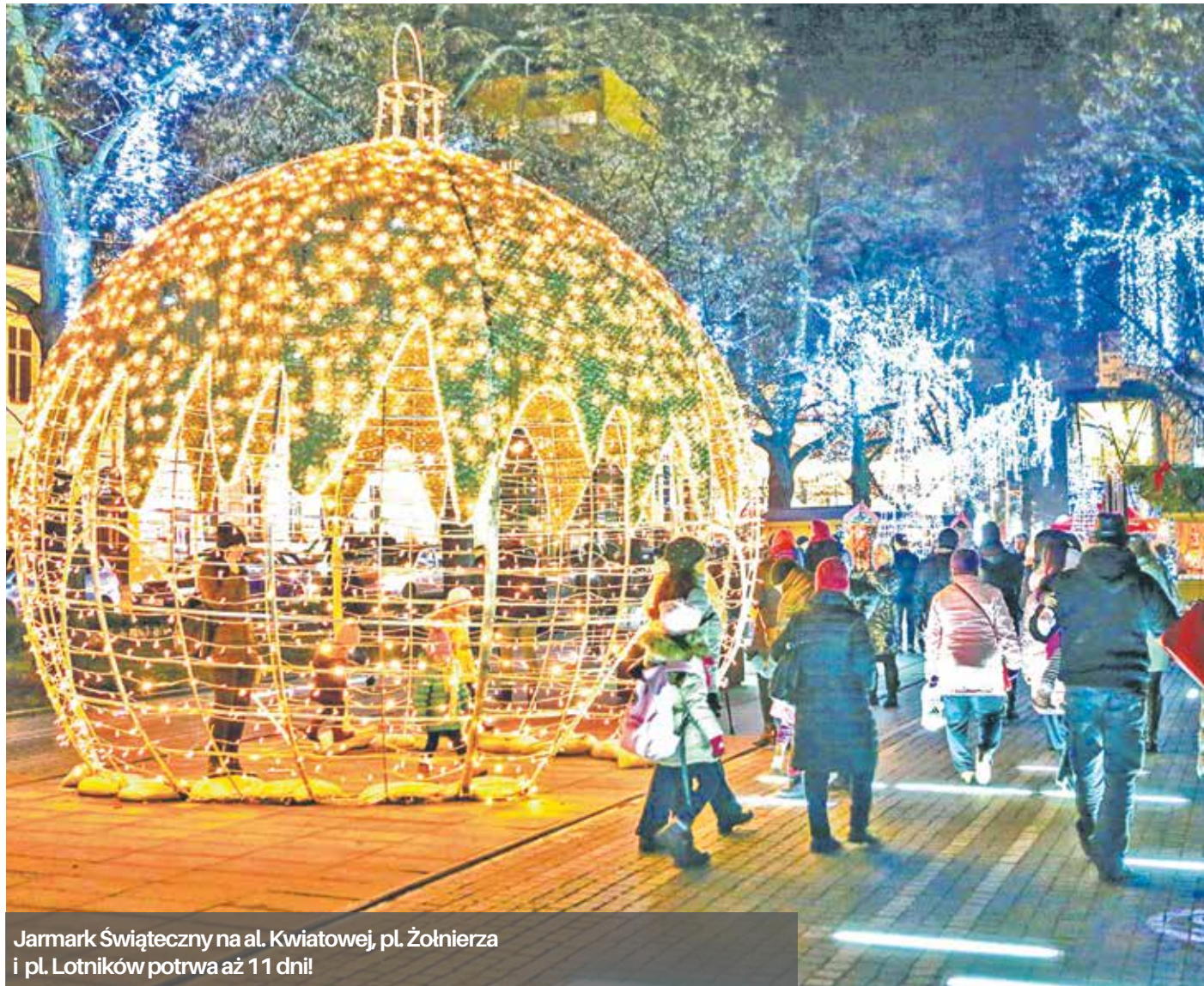
Jarmark Świąteczny na al. Kwiatowej, pl. Żołnierza i pl. Lotników potrwa aż 11 dni!

Zgodnie ze świąteczną tradycją pocałunek złożony pod jemiolą na ustach ukochanej osoby wróży miłość na długie lata. By nieco pomóc zakochanym na terenie jarmarku powstanie jemiolowy zakątek. Może być to niebywała szansa do zapewnienia sobie szczęścia w miłości na resztę życia!