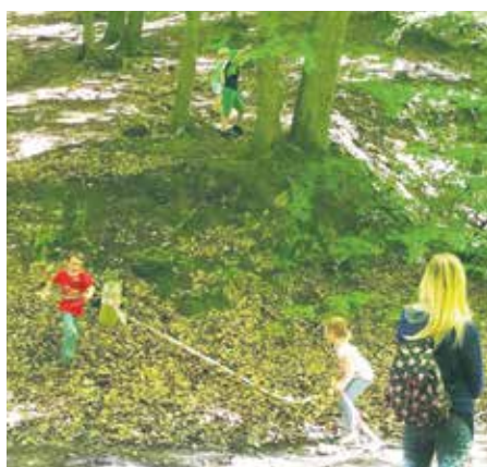
Rodzinne Rajdy po puszczy Bukowej cieszą się zawsze ogromnym powodzeniem