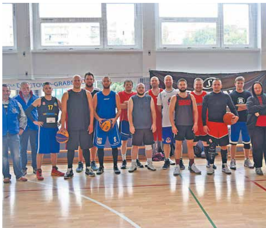
Turniej koszykówki Drzetowo-Grabowo

Co to znaczy? Dzięki wygranej w SBO (edycja 2017) zasadzono w naszej dzielnicy 2500 róż!