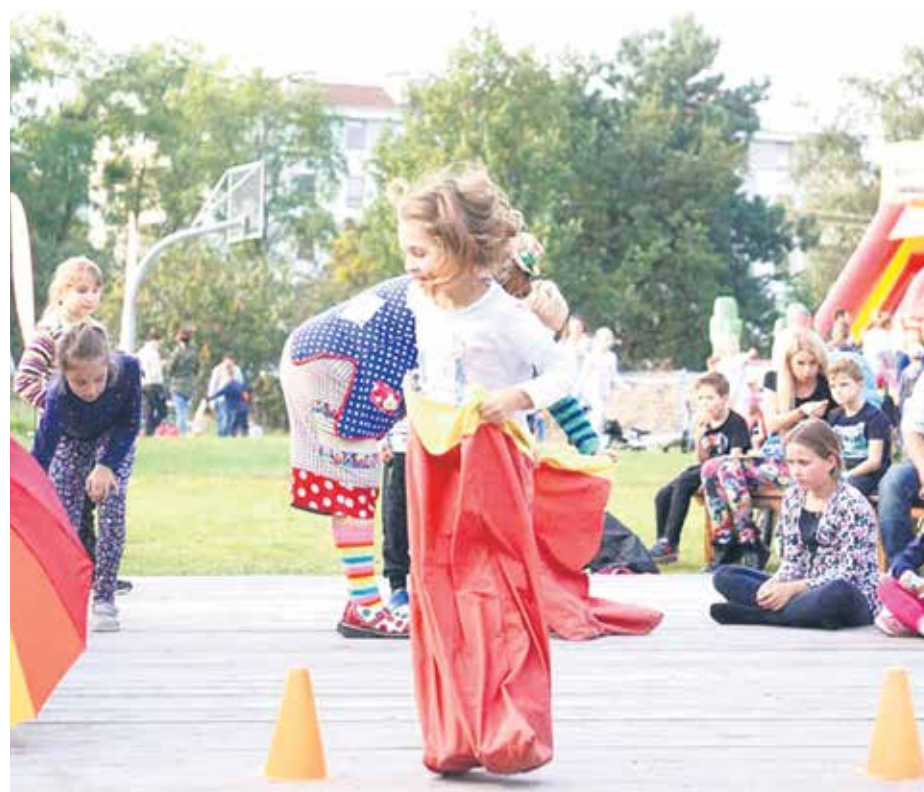
Festyn w Kijewie