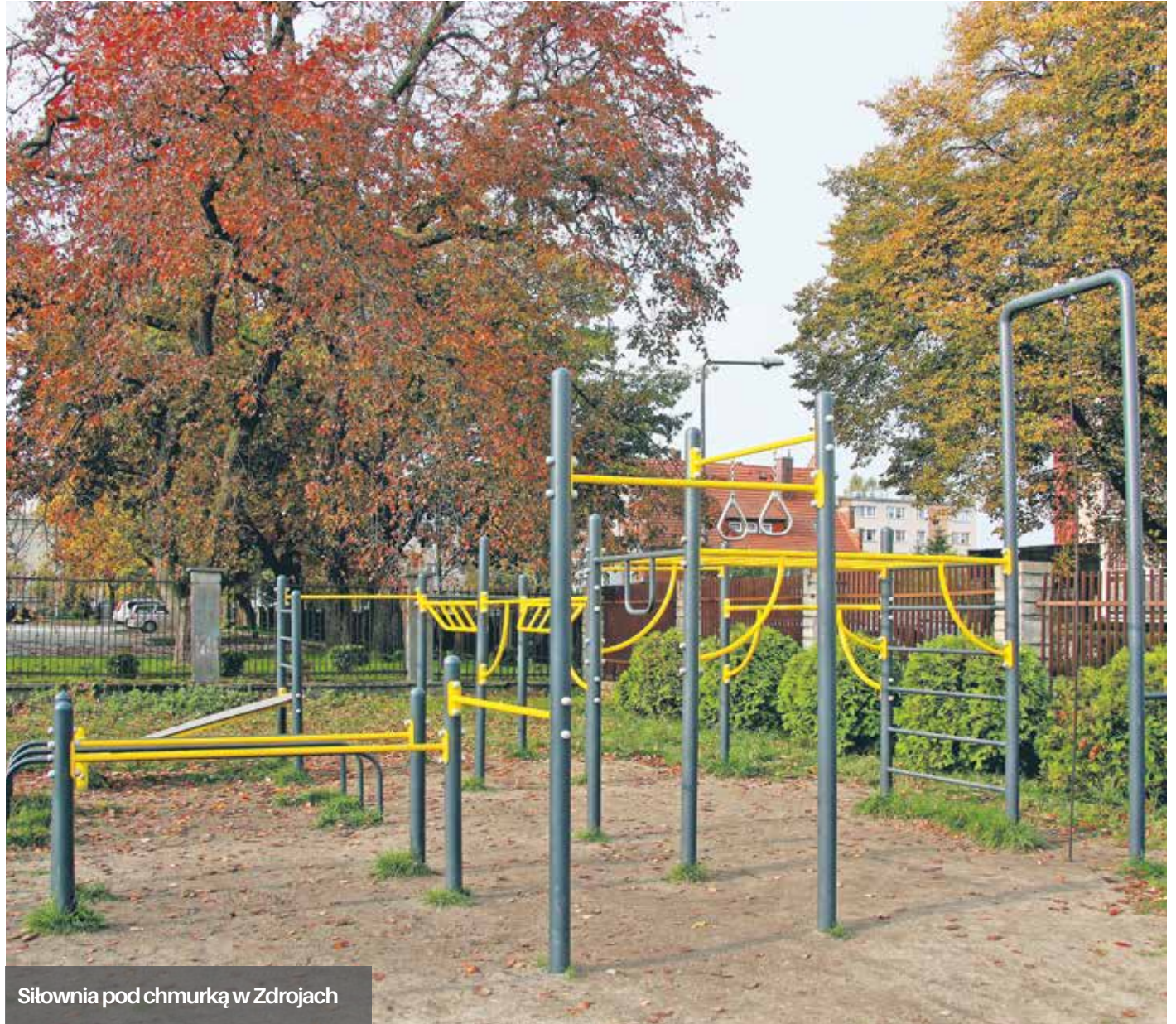
Siłownia pod chmurką w Zdrojach

Kolejna, tym razem specjalistyczna przeznaczona dla dzieci z ograniczeniami sprawności powstaje właśnie na terenie szkoły przy ul Letniskowej. Z innych dokonań upływającego roku możemy się pochwalić zagospodarowaniem zaniedbanego zielenca przed sklepem Społem przy ul Batalionów Chłopskich, oraz budową kolejnego odcinka piłkochwyty na boisku przy ul Zakątek.