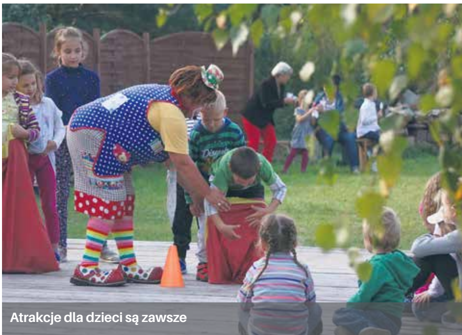
Atrakcje dla dzieci są zawsze