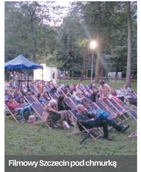
Filmowy Szczecin pod chmurką