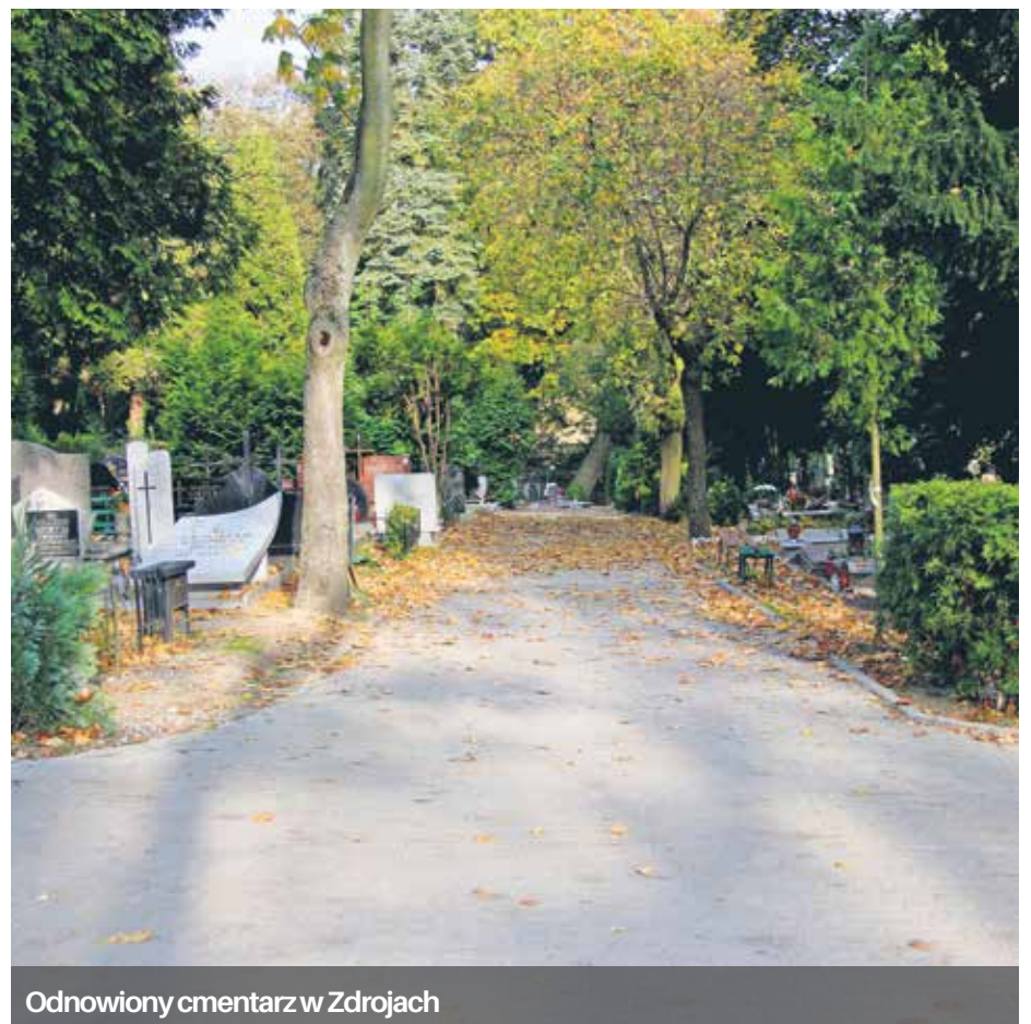
Odnowiony cmentarz w Zdrojach