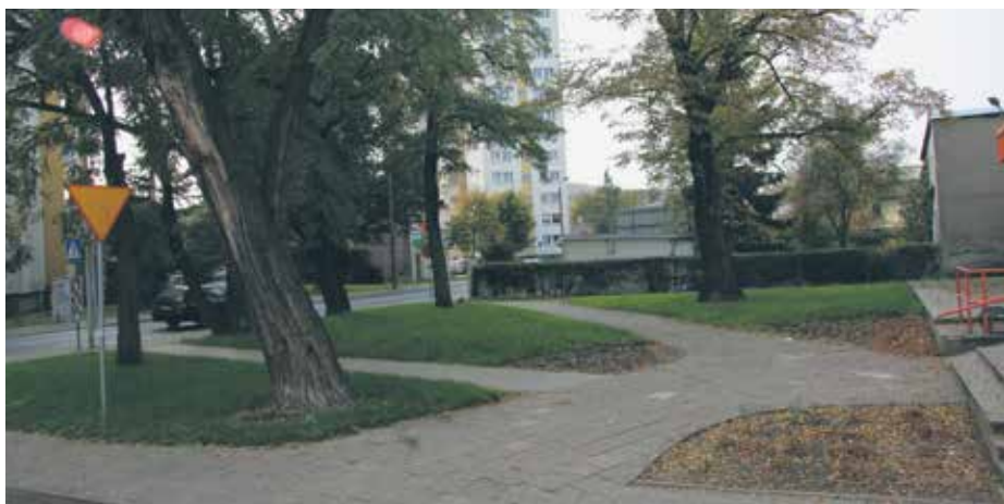
Zagospodarowanie terenu przy poczcie

Cieszy też znajdująca się w stanie zamkniętym budowa pięknej hali sportowej na terenie szkoły przy ul. Młodzieży Polskiej . Miejmy nadzieję, że już w przyszłym roku szkolnym będą się w niej odbywać zajęcia dydaktyczne i sportowo-rekreacyjne.