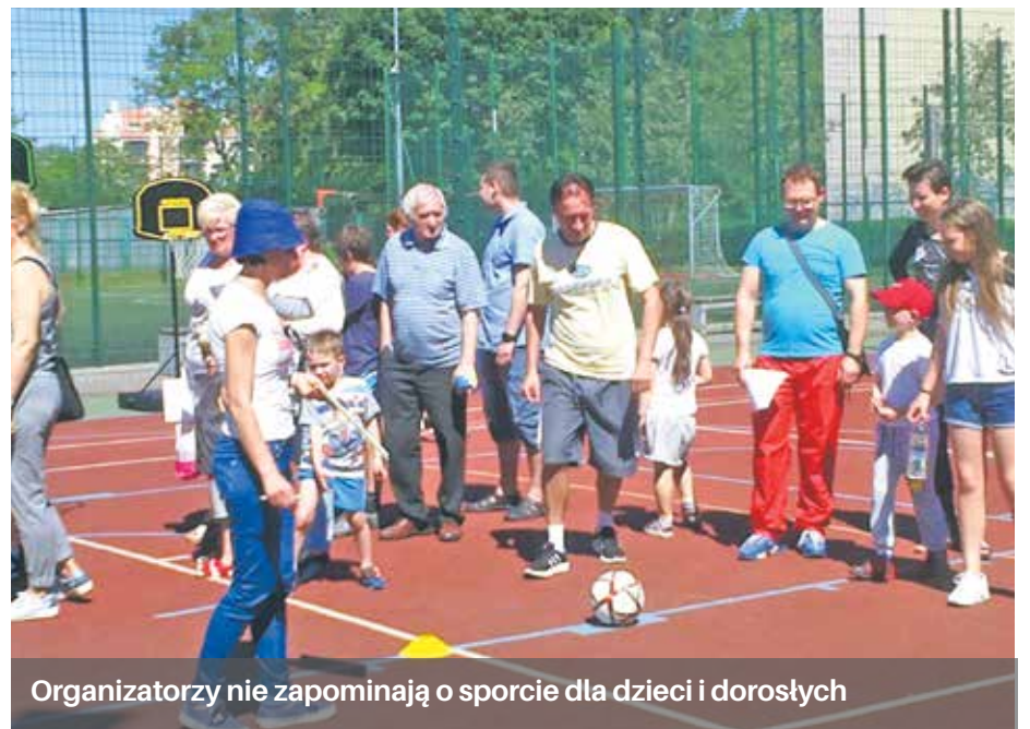
Organizatorzy nie zapominają o sporcie dla dzieci i dorosłych