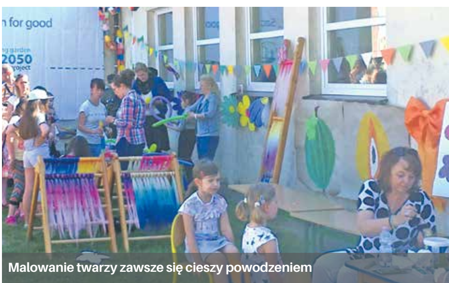
Malowanie twarzy zawsze się cieszy powodzeniem

Tego typu festyny odbywają się też w różnych dzielnicach miasta.