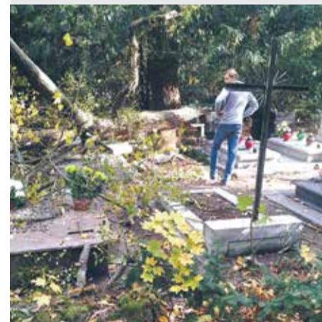
Cmentarz Centralny - spadł konar z drzewa na groby, na szczęście nikomu się nic nie stało.

Z nowej, ulepszonej wersji aplikacji Alert Szczecin 2.0 można korzystać w urządzeniu mobilnym (telefon, tablet) opartym na Androidzie, systemie iOS czy Windows Phone.