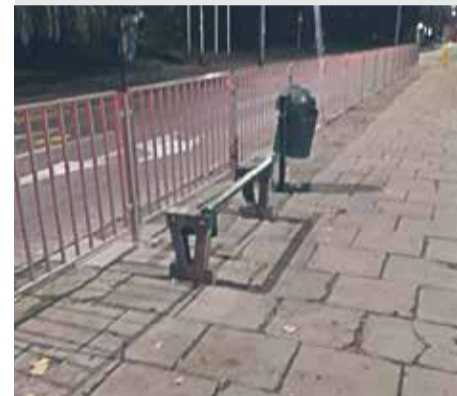
Zniszczona ławka na przystanku „Matejki” dla linii 5 i 11, w kierunku Placu Rodła.