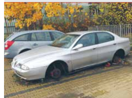
Wraki samochodów, ul. Wszystkich Świętych