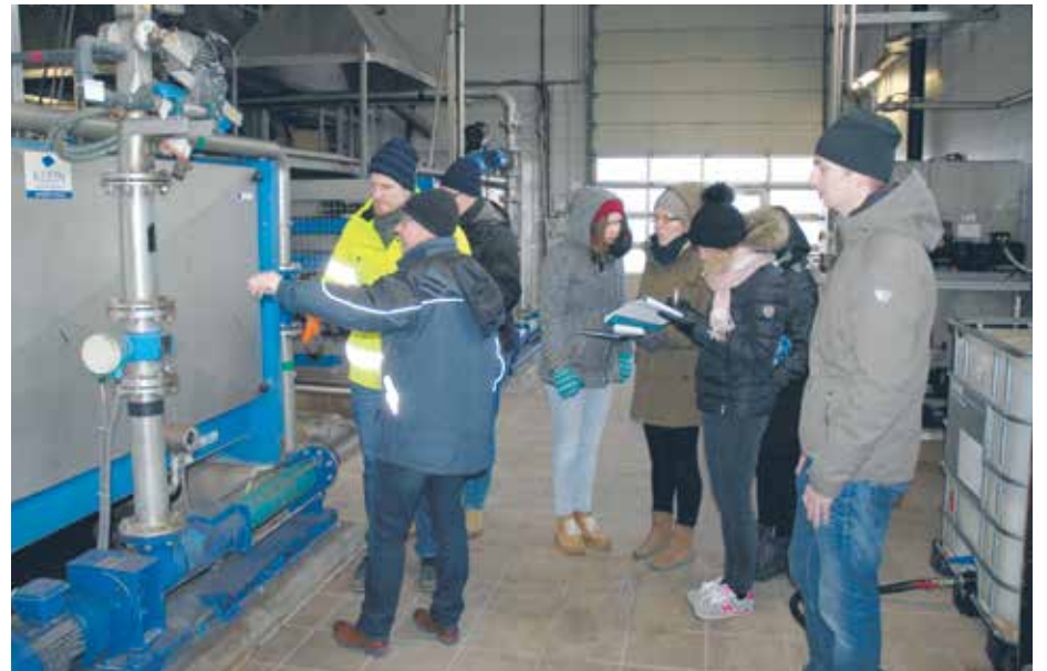
Wizyta audytorów w oczyszczalni „Pomorzan”

Projekt IWAMA jest współfinansowany z Europejskiego Funduszu Rozwoju Regionalnego w ramach Programu Regionu Morza Bałtyckiego INTERREG na lata 2014-2020. Całkowity budżet projektu: 4,6 mln EUR, a współfinansowanie z EFRR wynosi 3,7 mln EUR.