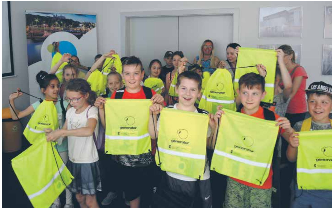
Zwiedzanie EcoGeneratora. N/z: uczniowie i opiekunowie klasy 3b z SP 12 w Szczecinie

„Niebo jest niebieskie, a trawa zielona, wyszłam szczęśliwa z EcoGeneratora!”